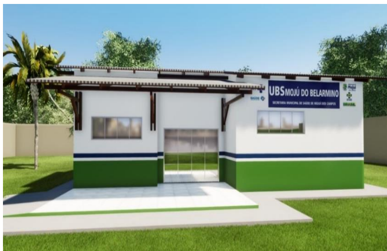
Aspecto final da pintura externa.