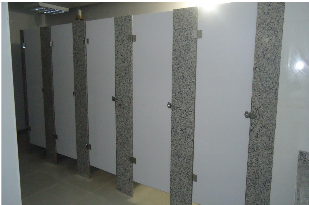
Modelo de instalação de portas e granito nos banheiros