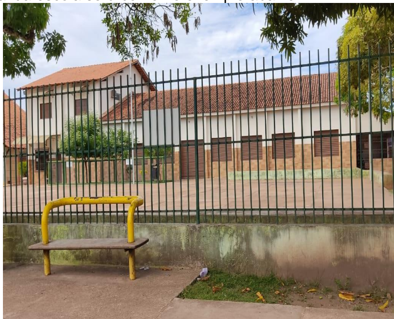
Modelo do muro de entrada

O muro frontal da escola será como no exemplo abaixo: