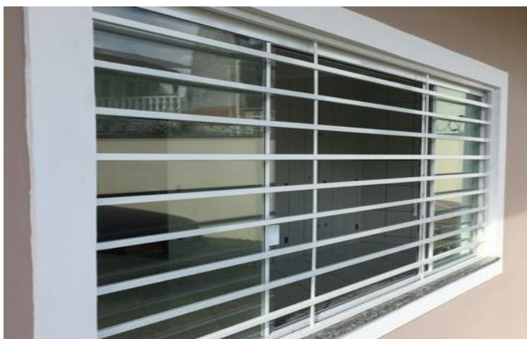
Modelo de esquadria superior das salas de aula

Para melhor iluminação e ventilação das salas de aula será executado, acima do elemento vazado de ½ tijolo, grade de ferro em metalon, devidamente pintado em cor esmalte cinza, chumbado verticalmentenas vergas e contravergas conforme exemplo na imagem abaixo.