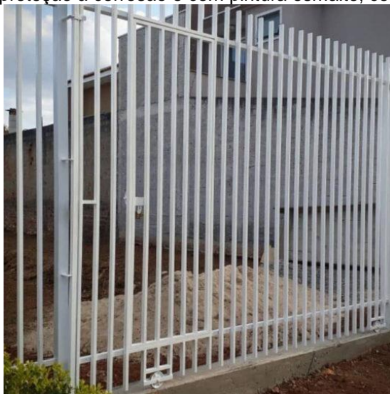
Modelo do portão de entrada

Haverá um portão de padrão similar às grades, em trilho de correr, medindo 3,5m de largura por 2m de altura. Haverá uma porta anexa ao portão com abertura de 1 metro. O mesmo deverá ser entregue com proteção à corrosão e com pintura esmalte, como no exemplo abaixo: