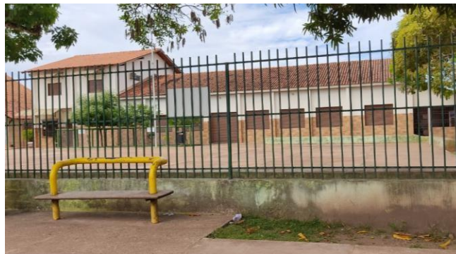
Modelo do muro de entrada

O muro frontal da escola será como no exemplo abaixo: