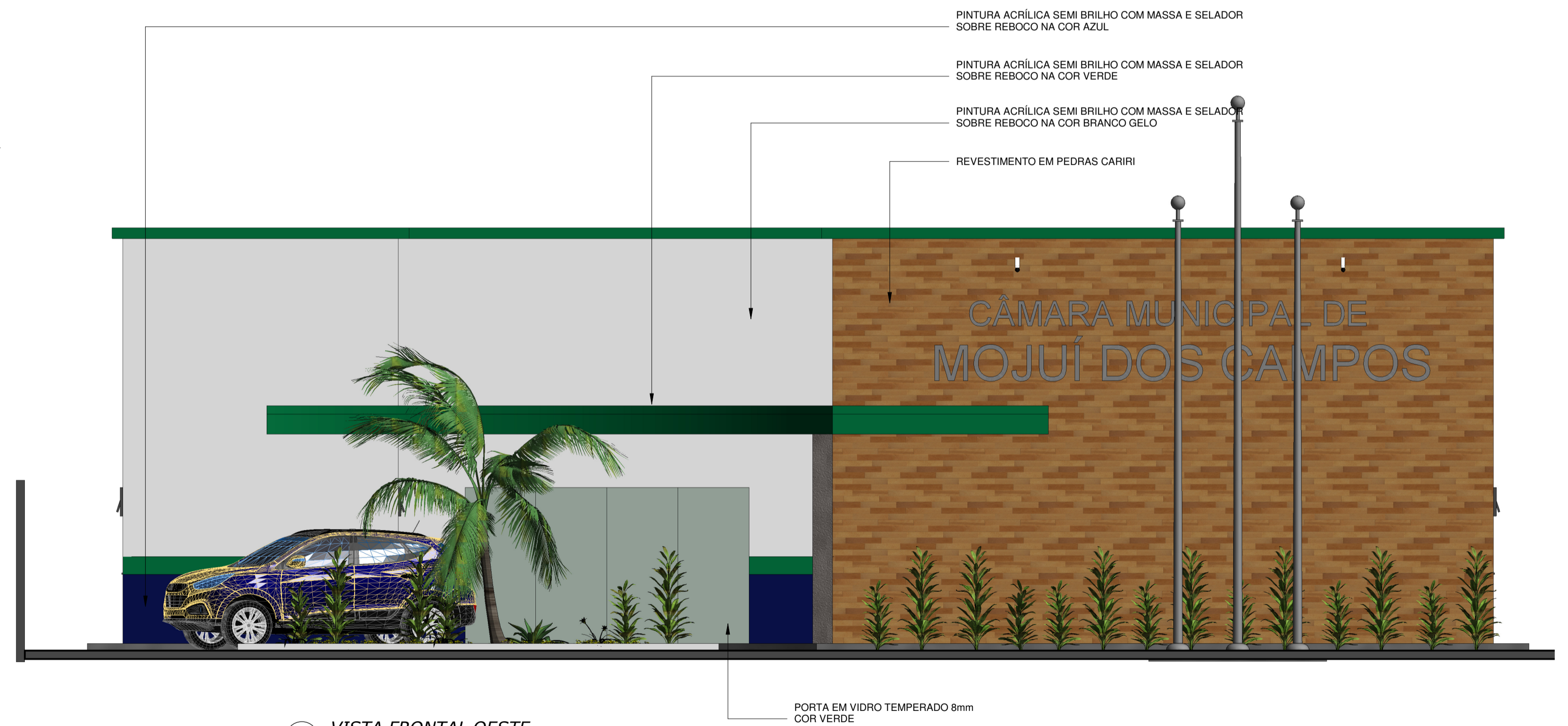
1 VISTA FRONTAL OESTE 1 : 50