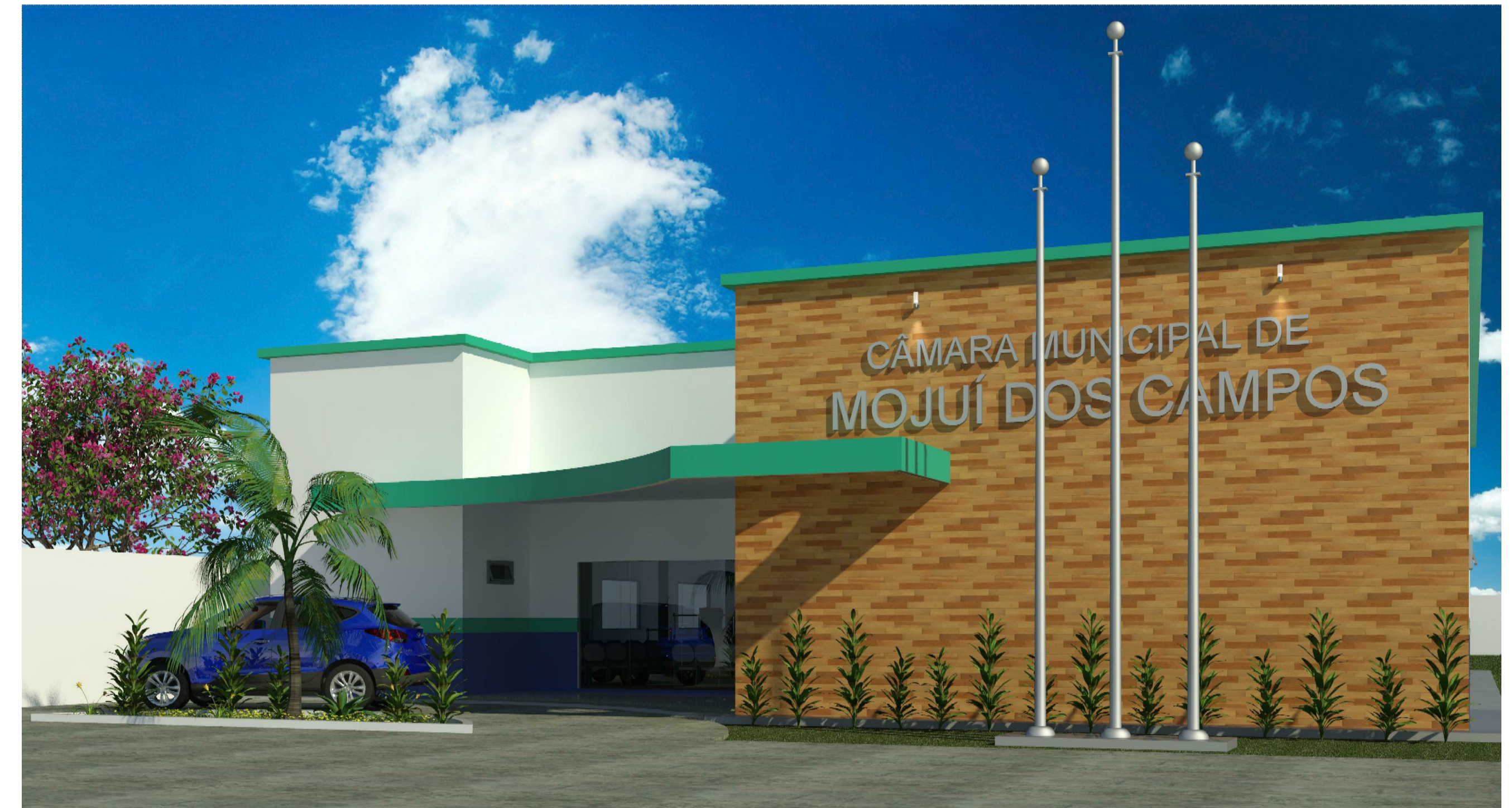
4 VISTA RENDER_3D 1 : 1